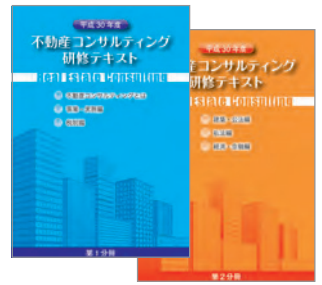
表紙はイメージです