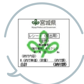
「レシート(提出用)」イメージ

なお、法定講習会(WEB講習・座学講習)に係る費用の総額(16,500円)は変更ありません。